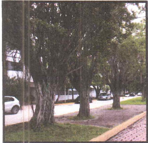
Figura 1.- Los árboles de Ficus presentan riesgo de caerse debido al sobrepeso que tienen sus copas (la realización de la poda a esta edad del árbol solo a los factores climatológicas que presenta la región, ya que no ha tenido los mantenimientos adecuados en su ciclo de vida vegetativa.